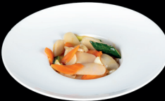
267. GNOCCHI DI RISO CON VERDURE (1,6) - 6€ gnocchi di riso saltati con zucchine, carote