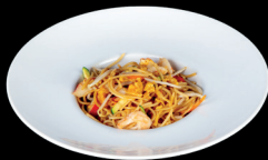
276. SPAGHETTI SALTATI CON VERDURE (1,3,6) - 6€ spaghetti saltati con verdure miste e uova