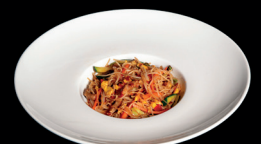
275. SPAGHETTI DI RISO CON MANZO PICCANTE (1,3,6) - 7€ spaghetti di riso saltati con manzo, verdure miste e uova