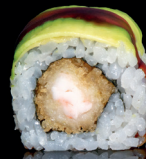
192. URA DRAGON (1,2,4,6,8) - 11€ riso avvolto con gambero in tempura, con sopra avocado e salsa teriyaki