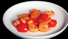
312. MAIALE IN AGRODOLCE (2) - 8€ gamberi e salsa agrodolce