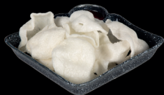
1. NUVOLETTE DI DRAGO - 3,5€ (1,2)

Sfoglia di riso insaporita al gusto di gambero