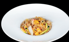
274. SPAGHETTI DI SOIA CON FRUTTI DI MARE (1,2,3,4,6,14) - 7€ spaghetti di riso saltati con frutti di mare, verdure miste e uova