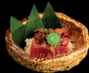
84. BENTO MAGURO - 12€ (1,4,6,7,8,10,11,12) mini chirashi con tonno e salsa wasabi