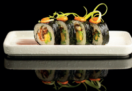
152. FUTO VULCANO (4,6) - 9€ alghe nori, riso, anguilla, avocado e salsa piccante