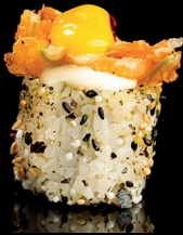
198. UNA FLOWER (1,3,4) - 11€ salmone avocado, maio vegano, fiori di zucchima, salsa tropical