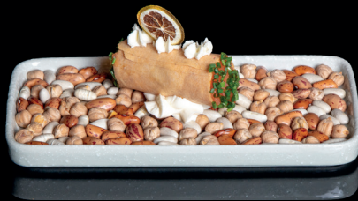
55. CANNOLO (2pz) - 7€ (3,4,7)

crostino croccante tonno rosso, phila, guacamole, olive nere