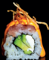
193. URA SPICY MAGURO - 12€ (1,2,3,4,5,6,7,8) riso avvolto con avocado e Philadelphia con sopra tonno e chipss