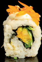
201. YASAI ROLL (3,4) - 8€ mix di verdure di giornata e frutta, maio vegana