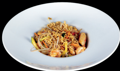
285. RAMEN SALTATI CON FRUTTI DI MARE (1,2,3,4,6,14) - 9€ ramen di riso in brodo con manzo, verdure miste e uova