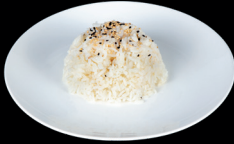
260. RISO BIANCO (11) - 2€ riso bianco e sesamo