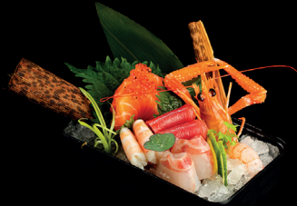
234. SASHIMI MIX (10pz) - 16€ (2,4) pesce misto, gamberi e scampi