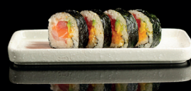
153. FUTOMIX (1,2,4,6) - 10€ alghe nori, riso, avocado e pesce misto