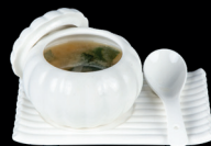
32. ZUPPA DI MISO (1,6) - 5€ zuppa di miso, tofu, alghe giapponese e erba cipollina