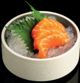
230. SASHIMI SAKE (8pz) - 10€ (4) salmon