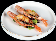
323. GAMBERONI ALLA PIASTRA (3pz) - 9€ (1,2,6,11)