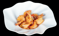
310. GAMBERI SALE E PEPE (2) - 8€ gamberi con sale e pepe, cipolla e peperoni