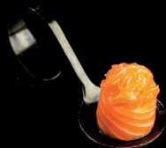
120. BIGNÈ SAKE (1,4) - 2,5€ riso avvolto da salmone con sopra tartare di salmone marinato