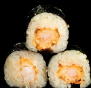
138. HOSO EBITEN (1,2) - 5,5€ alghe nori, riso, teriyaki e gambero in tempura