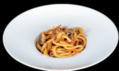
281. UDON CON MANZO PICCANTE (1,3,6) - 6,5€ spaghetti udon saltati con manzo, verdure miste e uova