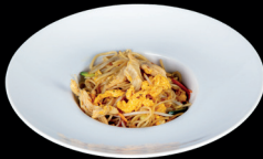
277. SPAGHETTI SALTATI CON POLLO (1,3,6) - 6,5€ spaghetti saltati con pollo, verdure miste e uova