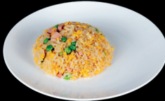
261. RISO ALLA CANTONESE (3) - 6€ riso saltato con uova, piselli e prosciutto cotto