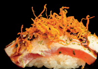
100. NIGIRI KATSUO MAGURO (1,4,6,7) - 2,5€ riso con tonno rosso flambato, cream chesse, teriyaki, chipss croccante nori