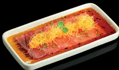
222. CEVICE MAGURO (1,3,6,8) - 10€ carpaccio di tonno, erba cipollina, chipss, datterino, ponzu, wasabi