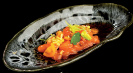
70. TARTARE SALMONE (1,4,6) - 8€ tartare di salmone, salsa ponzu, datterino, mix sakura