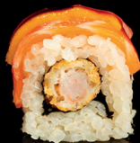
190. URA RAINBOW (1,2,4,6) - 13€ gambero in tempura, mix di pesce, teriyaki