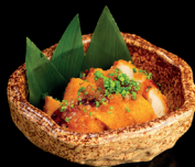
83. BENTO CHICHEN - 8€ (1,6,7) mini chirashi con pollo croccante, teriyaki salsa matsu, erba cipollina