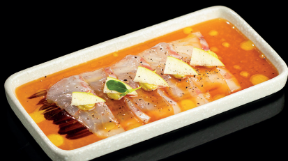
223. CEVICE SUZUKI (1,4,5,6) - 9€ carpaccio di ombrina, guacamole, mela verde, pepe, yuzu, olio evo