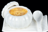
31. ZUPPA DI POLLO E MAIS (3) - 5€ zuppa di pollo,mais e uova