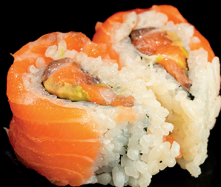
205. UNA LOVE (4PZ) (1,2,3,4,7) - 9€ uramaki a forma di cuore con riso, alghe nori, salmone, avocado e surimi conditi con maionese