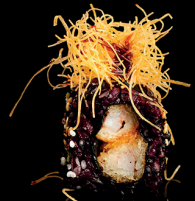
172. URA BLAK EBITEN (1,2,3,6) - 10€ gambero in tempura teriyaki riso venere