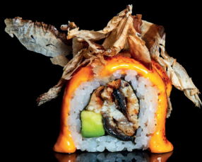
211. URA VULCANO (1,4,6,7) - 12€ riso avvolto con anguilla e avocado con sopra salse a scelta dello chef e katsubushi