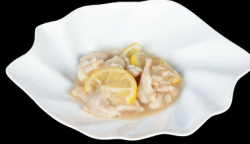
301. POLLO AL LIMONE - 7€ pollo e limone