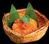
81. BENTO SAKE - 10€ (1,4,6,7) mini chirashi al salmone con salsa matsu