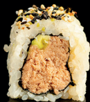
187. URA TUNA ROLL (1,4) - 9€ tonno cotto avocado