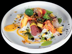
233. SASHIMI BUFALA - 15€ (1,2,4,5,6,7) mix pesce del giorno servito con bufala, mango, pistacchio e salsa a scelta dello chef