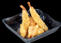
23. TEMPURA MISTA - 10€ (1,2)

verdure miste fritti in tempura con salsa tempura