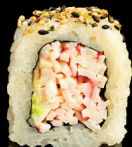
188. CALIFORNIA (1,2,3,6,7) - 9€ avocado, sesamo e surimi conditi con lime, maio, gambero e tobiko