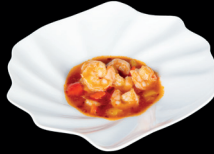
309. GAMBERI PICCANTI (2) - 8€ gamberi con cipolla, peperoni e salsa piccante