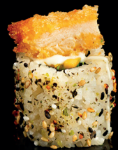
207. URA CHICHEN (1,3,7) - 9€ insalata avocado, maio, pollo croccante, teriyaki