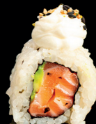
189. URA PHILADELPHIA (1,3,4,7) - 9€ salmone avocado philadelphia