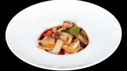
306. MANZO PICCANTE (1,6) - 8€ fette di manzo saltato con salsa piccante