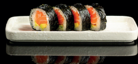
151. FUTO SAKE (4) - 8€ algher nori, riso, salmone e avocado