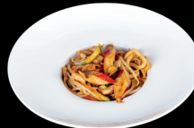
282. UDON CON FRUTTI DI MARE (1,2,3,4,6,14) - 7€ spaghetti udon saltati con frutti di mare, verdure miste e uova