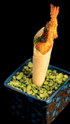
48. CONO EBITEN (2pz) - 7€ (1,2,3,6,7) sfoglia croccante al forno, gambero in tempura, maio, teriyaki, nori in polvere