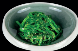
37. ALGHE WAKAME (1,,11,12) - 5€ insalata di alghe