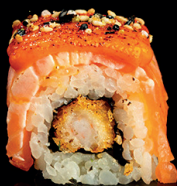
209. URA TIGER KIMCHI (1,2,4) - 12€ gambero in tempura, salmone flambè, salsa kimchi