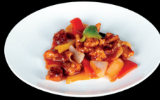
304. MAIALE IN AGRODOLCE (1,6) - 7€ carne di maiale fritto servito con salsa agrodolce con ananas, peperoni e cipolla