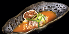
72. TARTARE WHITE (1,4,6,7) - 8€ tartare di pesce bianco, yuzu erba cipollina, nocciole croccante