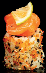
203. URA FRESH (1,2,4,11) - 12€ mix di pesce mela verde, masago, sesamo, salmone, lime