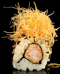
202. URA EBITEN (1,2,6) - 9€ gambero in tempura chips teriyaki