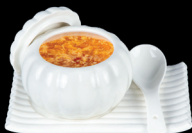
30. ZUPPA AGROPICCANTE (1,3,6) - 5€ Zuppa agropiccante con pollo, tofu, uova, funghi (orecchio di giuda) e bambù