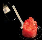
122. BIGNÈ MAGURO (1,4) - 3€ riso avvolto da tonno con sopra tartare di tonno marinato