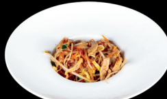
271. SPAGHETTI DI SOIA CON MANZO PICCANTE (1,6) - 7€ spaghetti di soia saltati con manzo, verdure miste e salsa piccante