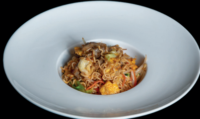
286. RAMEN SALTATI CON MANZO PICCANTE (1,3,6) - 7€ ramen di riso in brodo con frutti di mare, verdure miste e uova