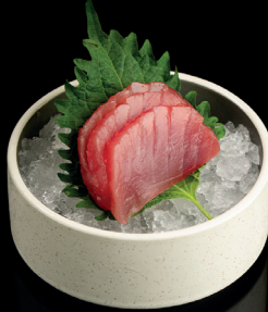
231. SASHIMI MAGURO (8pz) - 12€ (4) tonno