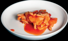
303. POLLO AGRODOLCE (1,8) - 7€ pollo e salsa agrodolce