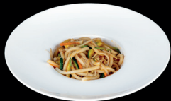
280. UDON CON VERDURE (1,3,6) - 6,5€ spaghetti udon saltati con verdure miste e uova