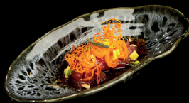
71. TARTARE MAGURO (1,4,6,10) - 10€ tartare di maguro, ponzu, wasabi, datterino, avosado, chips