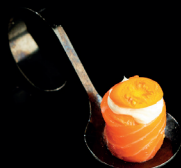
121. BIGNÈ PHILA DATTERINO (1,4,7,8) - 2,5€ riso avvolto da salmone con phila e datterino al forno