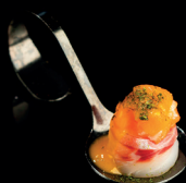
123. BIGNÈ SAKE WHITE (1,4) - 2,5€ riso avvolto da branzino con sopra tartare di salmone marinato, salsa passion fruit