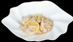
311. POLLO AGRODOLCE (2) - 8€ gamberi e limone