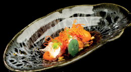
73. TARTARE ROSSO DI MAZZARA (1,4,6,10) - 10€ tartare di gambero rosso, ponzu, wasabi, straciatella, datterino, chips