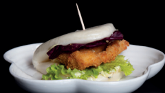
5. GUABAO CON POLLO E MAIONESE (1pz) - 6€ (1,3,7)

pane con pollo fritto, insalata e maionese