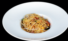
278. SPAGHETTI SALTATI CON FRUTTI DI MARE (1,2,3,4,6,14) - 7€ spaghetti saltati con frutti di mare, verdure miste e uova