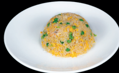
263. RISO CON GAMBERI (2,3) - 6,5€ riso saltato con uova, gamberi e verdure miste