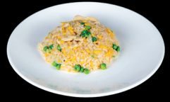
262. RISO CON POLLO (3) - 6€ riso saltato con uova, verdure miste e pollo