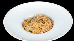
272. SPAGHETTI DI RISO CON VERDURE (1,3,6) - 6€ spaghetti di riso saltati con verdure miste e uova