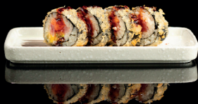
154. FUTO FRITTO (1,4,6) - 9€ ifuto salmone, avocado fritto con salsa teriyaki