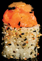
208. URA TRUFFLE TARTAR (1,2,4) - 11€ gambero in tempura, salmone condito con tartufo sotto olio