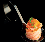
125. BIGNÈ SAKE KIMCHI (1,4) - 2,5€ riso avvolto con salmone flambato, salsa kimchi ed erba cipollina