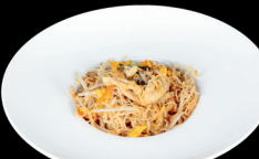
273. SPAGHETTI DI SOIA CON POLLO (1,3,6) - 6,5€ spaghetti di riso saltati con pollo, verdure miste e uova