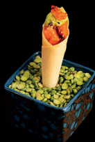
47. CONO SAKE (2pz) - 7€ (1,3,4,7,8) sfoglia croccante al forno di salmone condito, guacamole rivisitato, sesamo, uova di trota, teriyaki