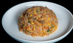
264. RISO CON MANZO PICCANTE (1,3,6) - 6,5€ riso saltato con manzo piccante e verdure miste