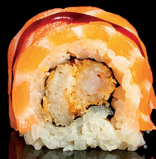
191. URA TIGER (1,2,4,6) - 12€ gambero in tempura, salmone, teriyaki