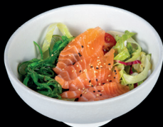
36. INSALATA DI CARPACCIO (1,4,11,12) - 6€ insalata con salmone crudo, wakame, sesamo e condita con la salsa della casa