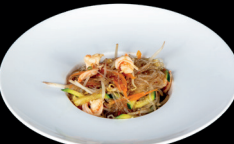
270. SPAGHETTI DI SOIA CON GAMBERI (1,2,6) - 7€ spaghetti di soia saltati con gamberi e verdure miste