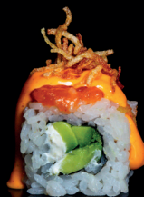
194. URA SPICY SAKE (1,2,3,4,6,7) - 11€ riso avvolto con avocado e Philadelphia con sopra salmone marinato e chipss