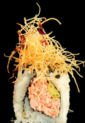
186. URA MIURA (1,4) - 9€ salmone cotto avocado