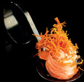
124. BIGNÈ SAKE CREAM (1,3,7) - 2,5€ riso avvolto con salmone flambato, cream cheese e chipss