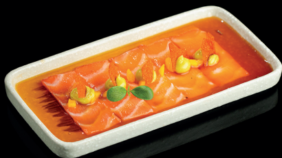
221. CEVICE SAKE (1,4,5,6) - 9€ carpaccio di salmone con guacamole, salsa ponzu e datterino