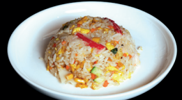
266. RISO CON FRUTTI DI MARE - 7€ riso saltato con frutti di mare