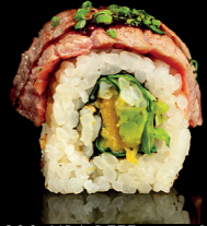
200. URA BEFF (1,4,6) - 12€ mix di insalata mango, avocado, manzo scottato, sale, pepe, teriyaki, erba cipollina