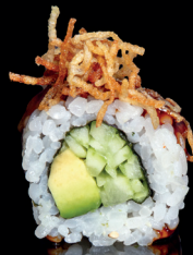
212. URA VEGANO - 8€ Riso avvolto con avocado e cetriolo con sopra salsa teriyaki e chipss