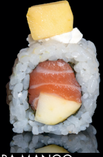
197. URA MANGO (1,3,4,7) - 11€ riso avvolto con salmone e mango con sopra mango e salsa mango e Philadelphia