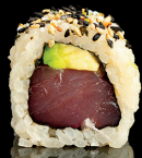
185. URA MAGURO AVOCADO (1,4) - 10€ tonno avocado