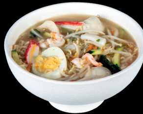
284. RAMEN IN BRODO CON FRUTTI DI MARE (1,2,3,4,6,14) - 10€ ramen di riso in brodo con frutti di mare, verdure miste e uova