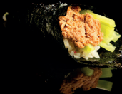
159. TEMAKI TUNA CETRIOLO (3,4,7,11) - 4€ tonno cotto, riso e cetriolo, avvolto in alghe nori con sesamo