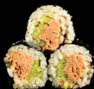
137. HOSO TUNA CETRIOLO - 5€ alghe nori, riso e cetrioli