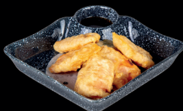
22. TEMPURA DI VERDURE (4pz) - 6€ (1)

gamberoni fritti in tempura con salsa tempura