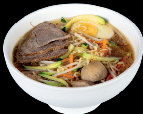
283. RAMEN IN BRODO PICCANTE CON MANZO (1,3,6) - 9€ ramen di riso in brodo con manzo, verdure miste e uova