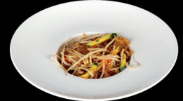
269. SPAGHETTI DI SOIA CON VERDURE (1,6) - 6€ spaghetti di soia saltati con verdure miste