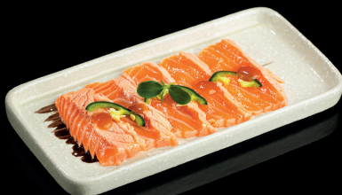
224. CEVICE SMOKE ABURI (1,4,6,7) - 11€ carpaccio sake aburi, con salsa miso, jalapeno