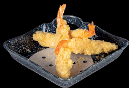
21. TEMPURA EBI (4pz) - 8€ (1,2)

gamberoni avvolti in kataifi con salsa agropiccante