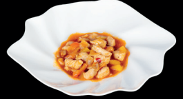
302. POLLO PICCANTE - 7€ pollo e salsa piccante