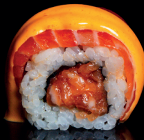
206. URA DIAVOLA (1,4,6,7) - 13€ riso avvolto da tartare di salmone marinato con sopra salmone, salsa spicy e hot spicy