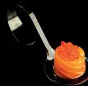
126. BIGNÈ IKURA (1,3,4,7) - 3€ riso avvolto da salmone flambato con sopra uova di pesce