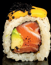
210. URA PASSION NOCCIOLA (1,4) - 11€ salmone avocado, salsa passion flambè, olive nere