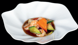
308. GAMBERI CON VERDURE (1,2,6) - 8€ gamberi con carote e zucchine