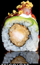
195. URA TRICOLORE (1,2,3,4,6,7) - 15€ gambero in tempura, guacamole, straciatella, gambero rosso di Mazzara