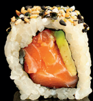
184. URA SAKE AVOCADO (1,4) - 9€ salmone avocado