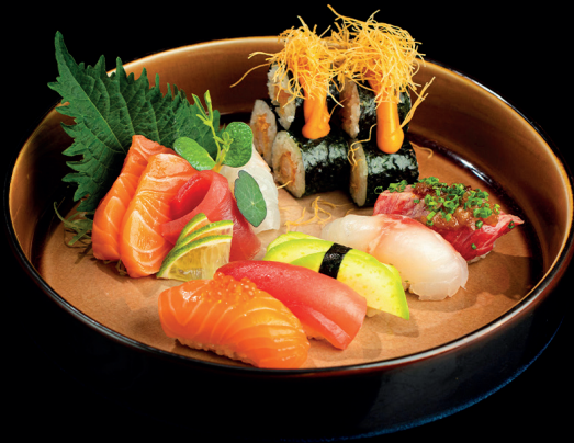
240. SUSHI MIX 12 PEZZI - 18€ (1,2,4) mix di sushi e sashimi