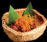
82. BENTO UNAGHI - 12€ (1,4,6,7) mini chirashi con anguilla kabayaki, chipss, erba cipollina