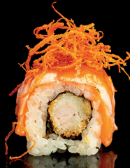
196. URA SMOKE (1,2,3,4,6,7) - 12€ gambero in tempura, salmone, miso dolce, chipss