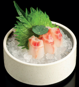
232. SASHIMI SUKURI (8pz) - 9€ (4) branzino