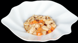
300. POLLO CON MANDORLE (1,8) - 7€ pollo con mandorle e carote