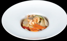
268. GNOCCHI DI RISO CON GAMBERI (1,2,6) - 7€ gnocchi di riso saltati con gamberi e verdure miste